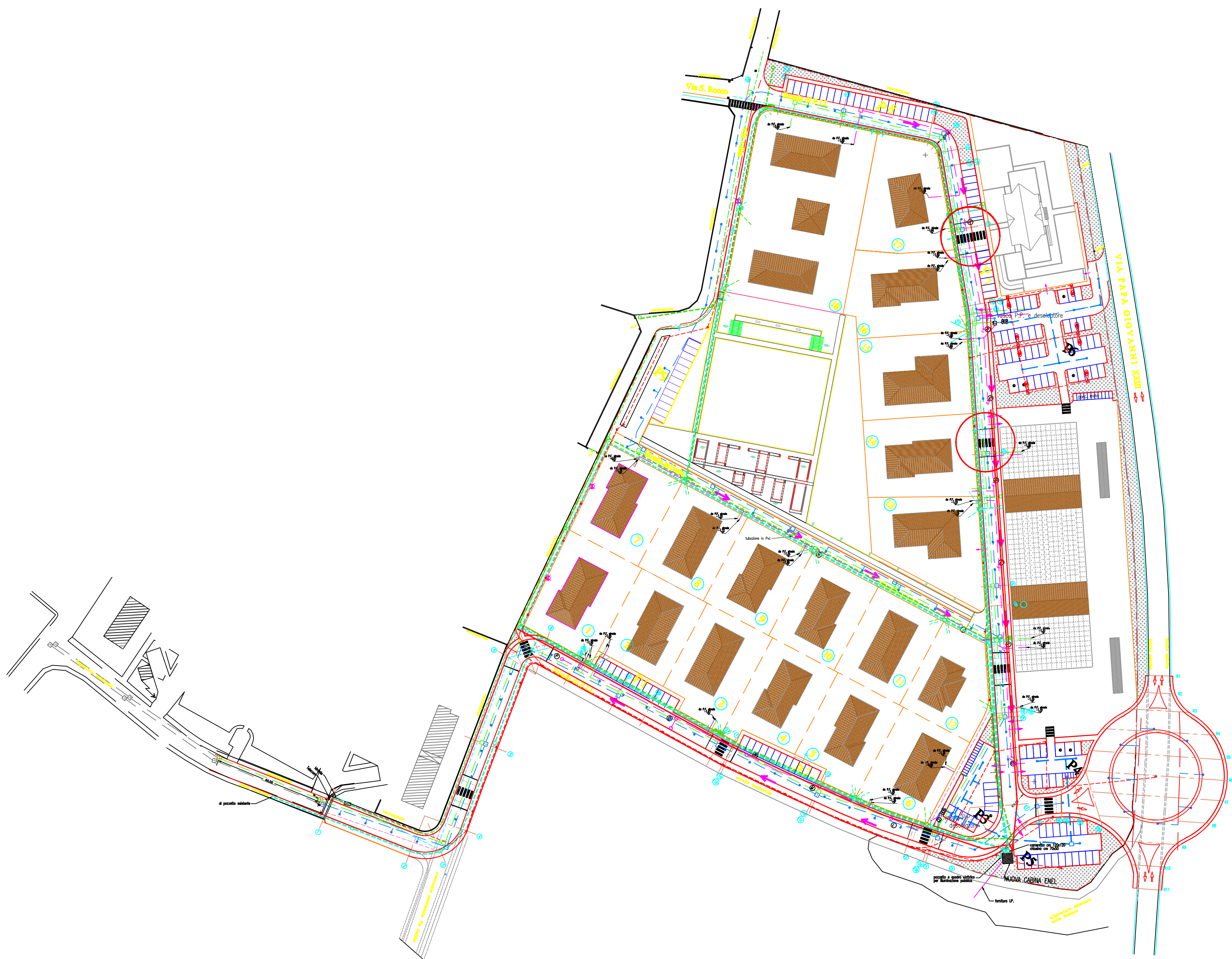
PLANIMETRIA D.i.a. 16404 DEL 05.12.2008 SCALA 1:1000